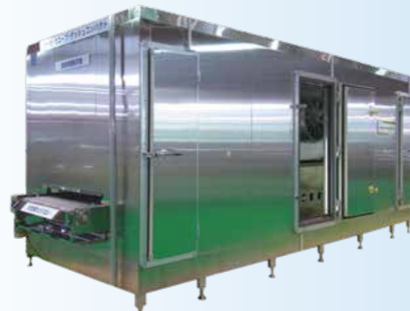
サーモウェーブ・ダッシュフリーザー