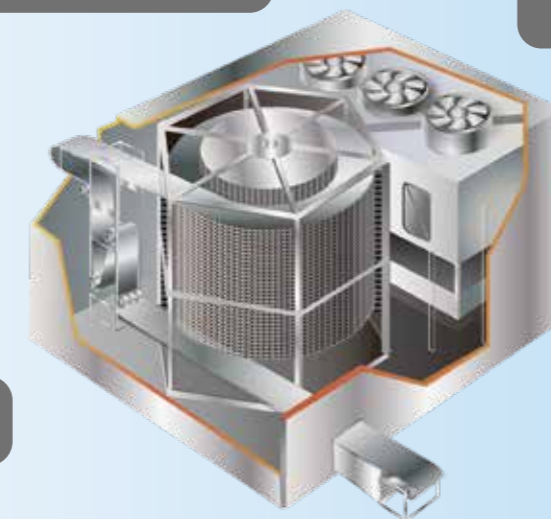
スパイラルフリーザー